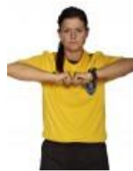
4. Omklamring, fastholdelse eller skub