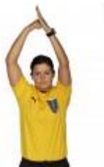
6. Offensive fejl begået af angriber