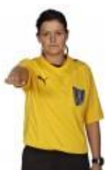
1. Indtræden i målfeltet