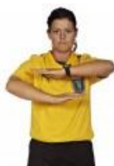
3. Skridt eller holde bolden mere end 3 sekunder